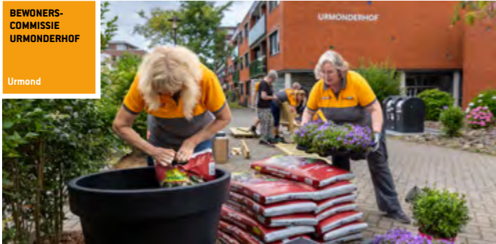
BEWONERS-COMMISSIE URMONDERHOF Urmond