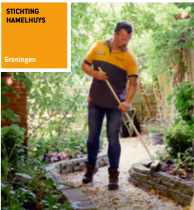
STICHTING HAMELHUIS Groningen