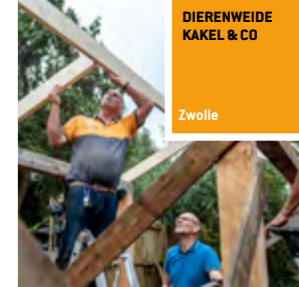
DIERENWEIDE KAKEL & CO Zwolle