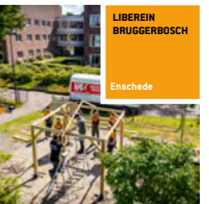
LIBEREIN BRUGGERBOSCH Enschede