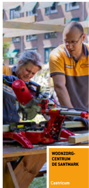
WOONZORG-CENTRUM DE SANTMARK Castricum