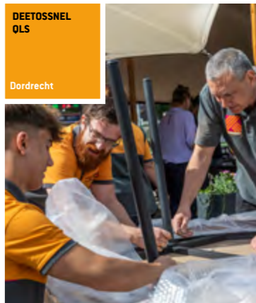
DEETOSSNEL OLS Dordrecht