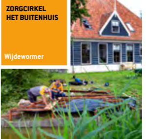
ZORGCIRKEL HET BUITENHUIS Wijdewormer