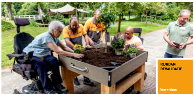
RIJNDAM REVALIDATIE Rotterdam