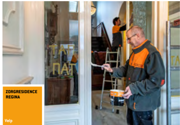
ZORGRESIDENCE REGINA Velp