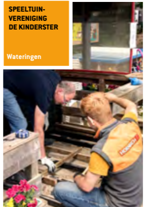
SPEELTUIN-VERENIGING DE KINDERSTER Wateringen