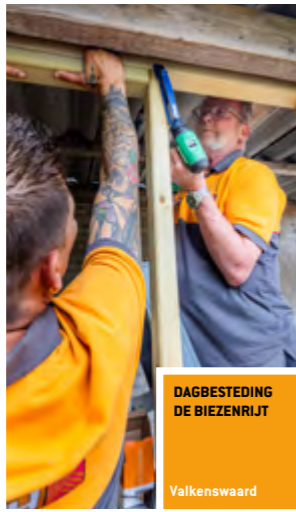
DAGBESTEDING DE BIEZENRIJT Valkenswaard