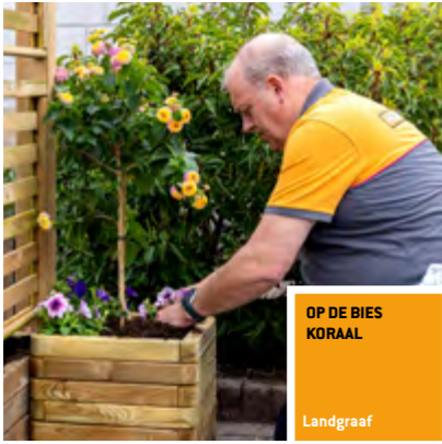
OP DE BIES KORAAAL Landgraaf