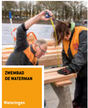
ZWEMBAD DE WATERMAN Wateringen