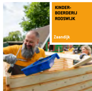
KINDER-BOERDERIJ ROOSWIJK Zaandijk