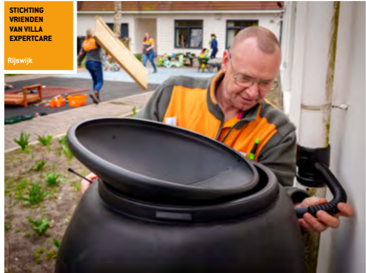
STICHTING VRIENDEN VAN VILLA EXPERTCARE Rijswijk