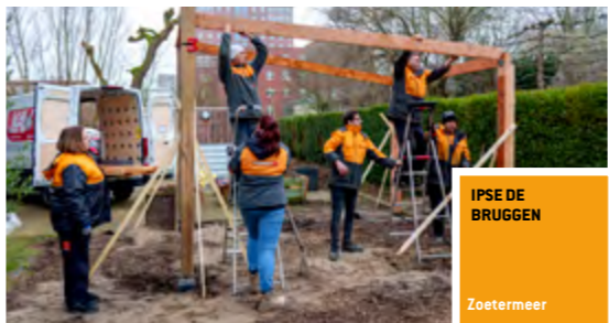
IPSE DE BRUGGEN Zoetermeer