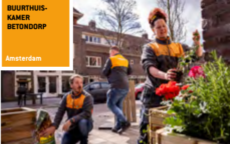
BUURTHUIS-KAMER BETONDORP Amsterdam