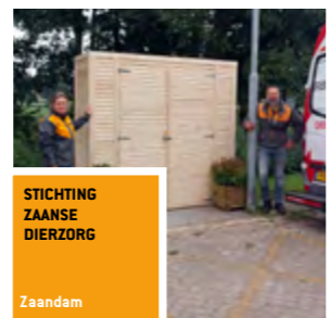
STICHTING ZAANSE DIERZORG Zaandam