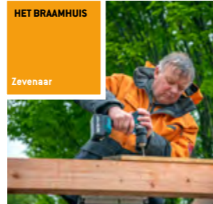
HET BRAAMHUIS Zevenaar